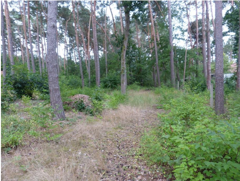
Bild 1: Blick vom Erikaweg nach Süden auf zentralen Bereich des Plangebiets (Flst. 330 u. 331)