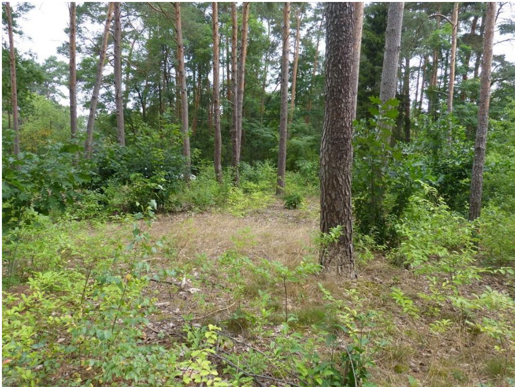
Bild 7: Blick von Süd nach Nord auf Ostteil des Plangebiets (Flst. 330)