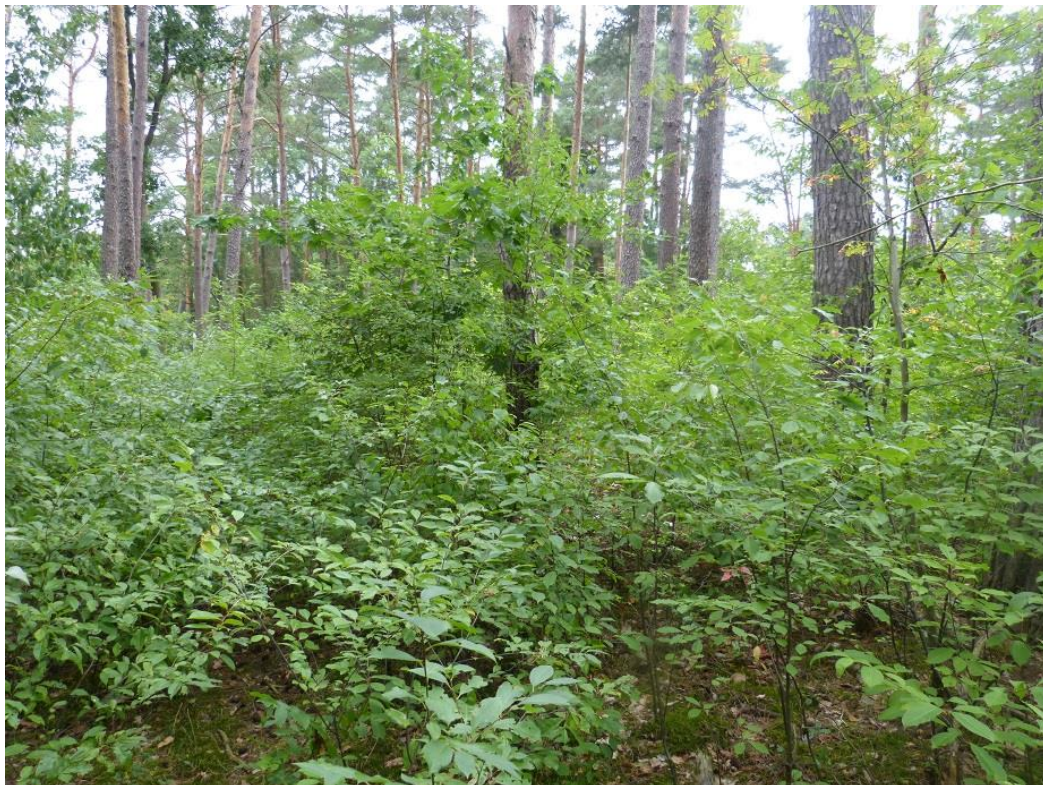
Bild 6: Blick nach Norden (Flst. 330 u. 331) aus dem Südteil des Plangebiets (Flst. 919)