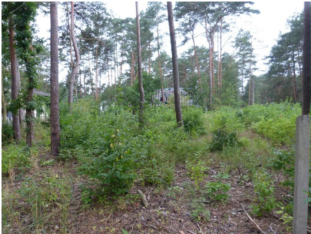
Bild 2: Blick von Ost nach West über den zentralen Bereich des Plangebiets (Flst. 330 u. 331)