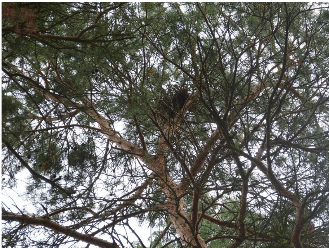
Bild12: Nebelkrähennest im Nordteil des Plangebiets (Flst. 330)