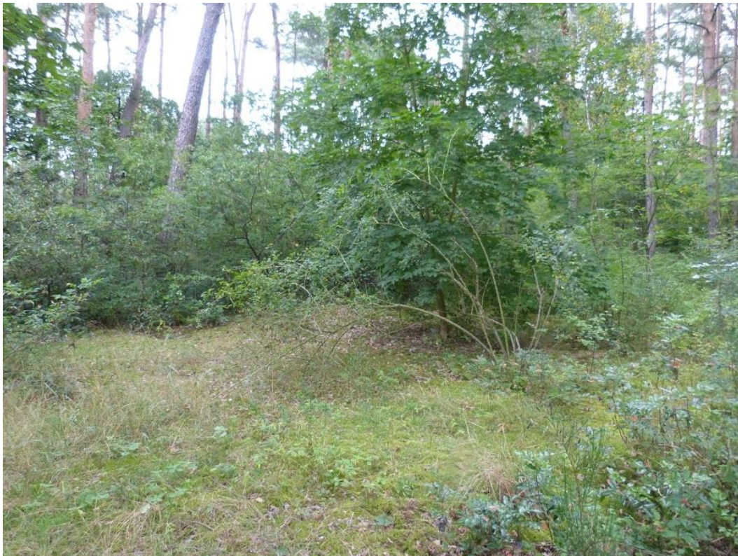
Bild 5: Blick nach Süden auf den Südteil des Plangebiets (Flst. 919)