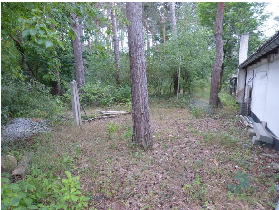
Bild 4: Blick nach Süden auf die südwestliche Plangebietsgrenze (Flst. 331)