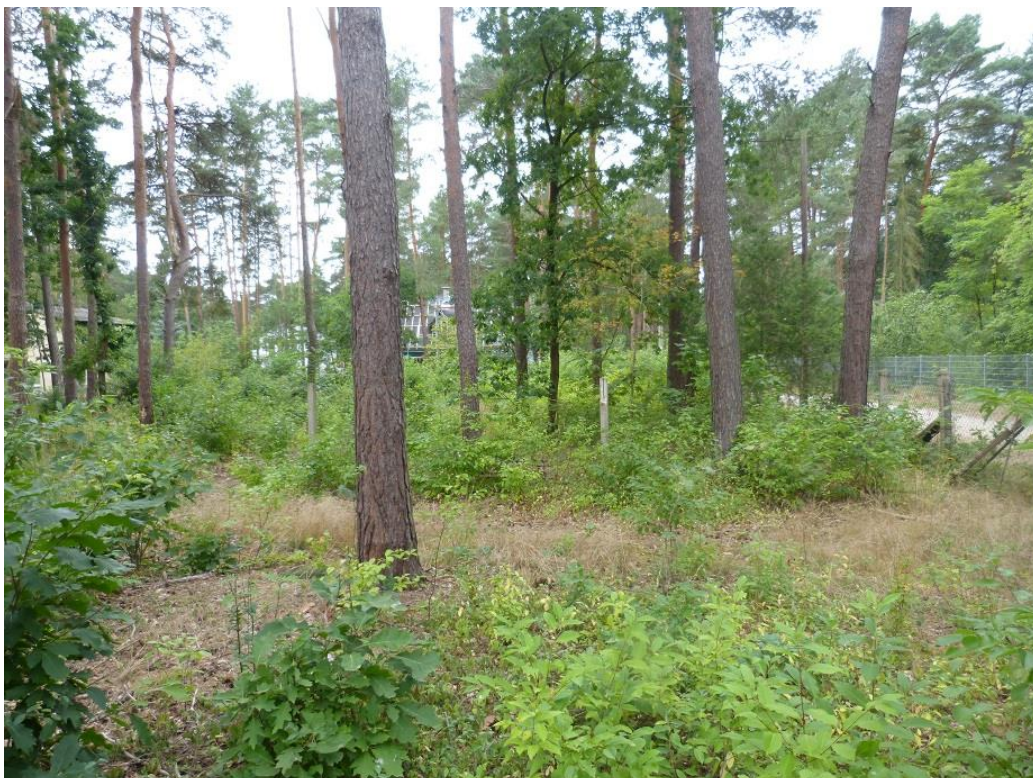
Bild 8: Blick von Ost nach West auf Nordteil des Plangebiets (Flst. 330 u. 331)