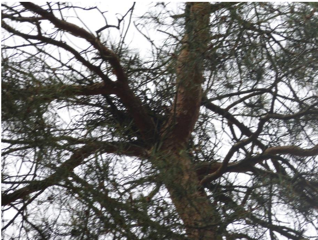
Bild14: Nicht besetztes Wechselnest der Nebelkrähe westlich des Plangebiets