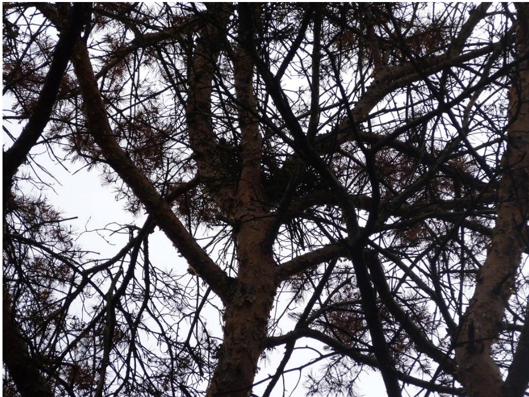
Bild 11: Ringeltaubennest an der Nordostgrenze des Plangebiets (Flst. 330)