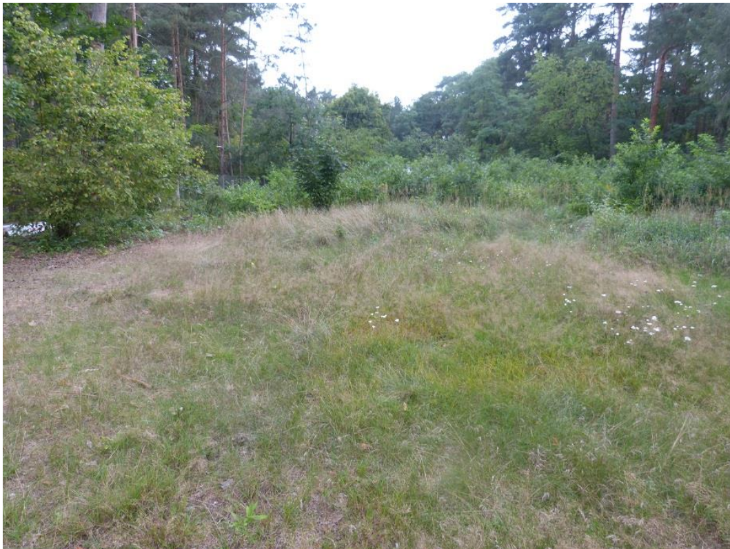
Bild 3: Blick von Nord nach Süd über den Westteil des Plangebiets (Flst. 917)