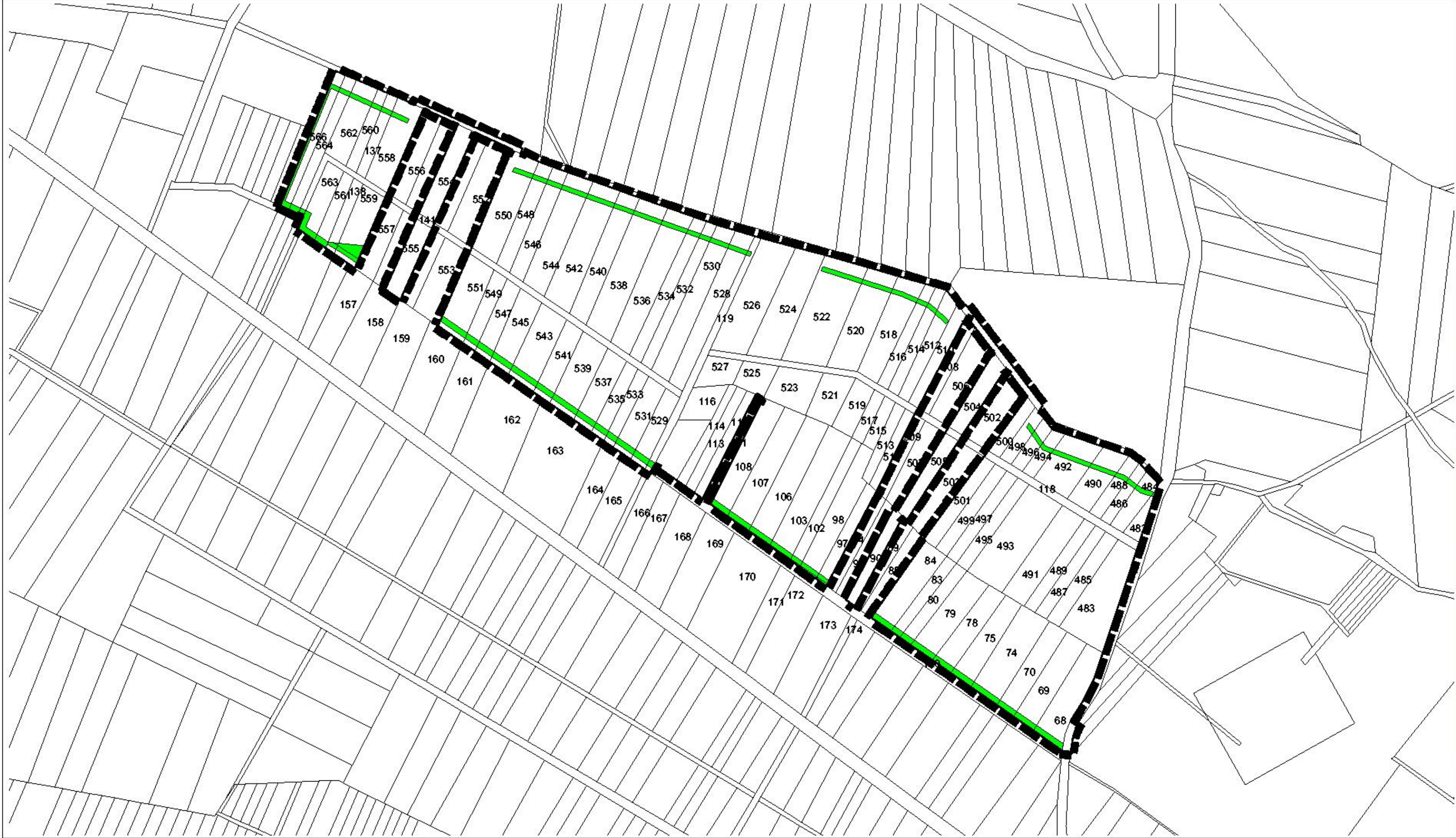
Übersichtskarte 1 : 25.000