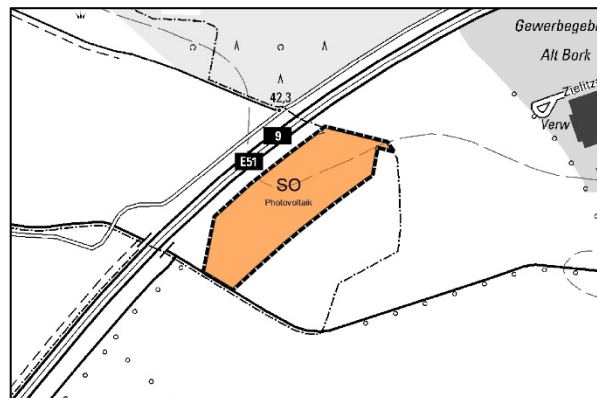
Abb. 2: Planfläche 5. FNP-Änderung

Die Eckdaten des Planungsraums werden im nachfolgenden Steckbrief zusammengefasst: