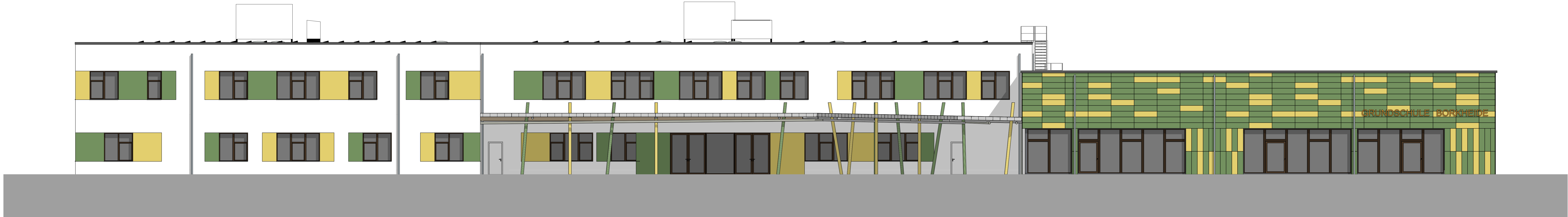
1 Ansicht Ost 1:100