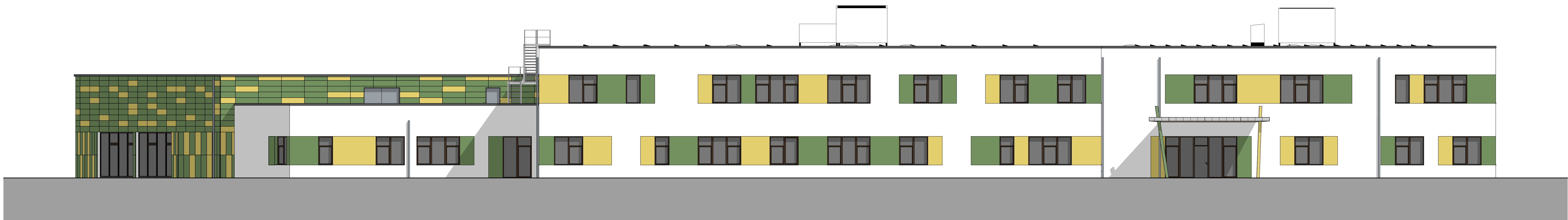
2 Ansicht West 1:100