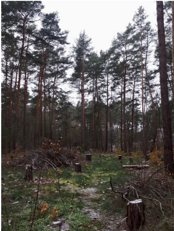
Abb. 8: Forstliche Nutzung hiebsreifer Bäume