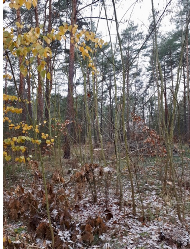
Abb. 5: Durch den Laubunterwuchs entwickelt sich der Kiefernwald zum Mischwald