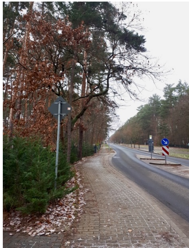
Abb. 3: Verlauf der Friedrich-Engels-Straße