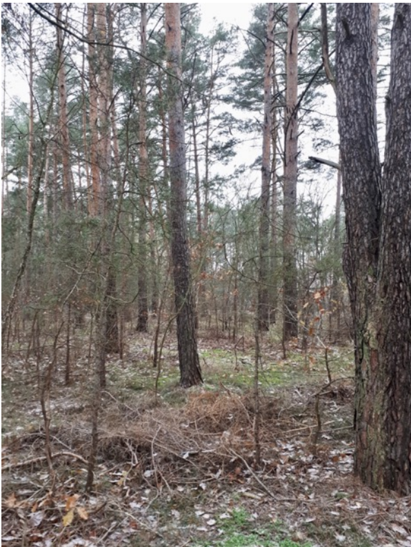
Abb. 6: Heterogene Altersstruktur des Kiefernwaldes