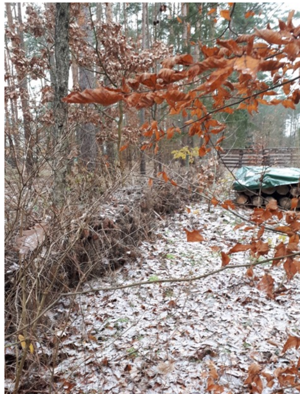
Abb. 11: Barriere aus Reisig-Material