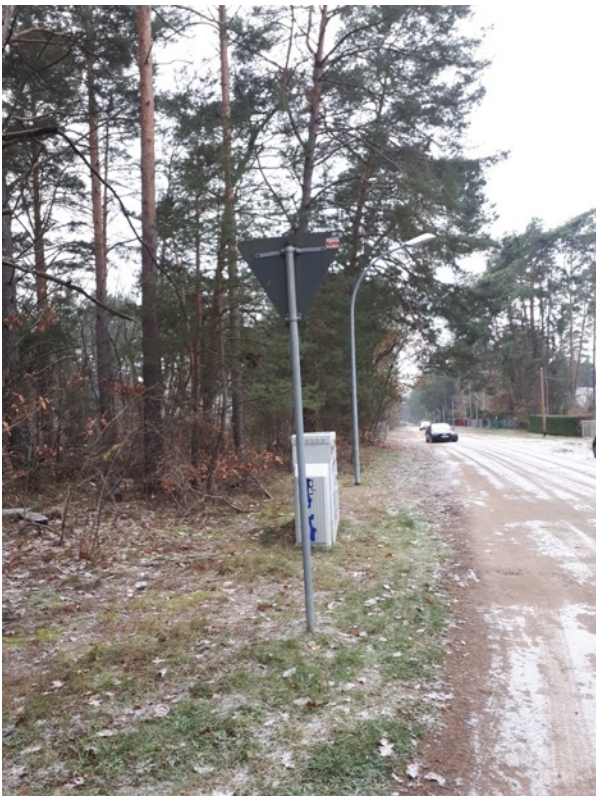
Abb. 2: Wegverlauf des Amselgrundes

Der Weg „Amselgrund“ (Abb. 2) verläuft am nördlichen Rand des Planungsraumes, während die „Friedrich-Engels-Straße“ (Abb. 3) den Geltungsbereich nach Osten hin begrenzt. Fast der gesamte Geltungsbereich ist von Kiefernwald geprägt (Abb. 4). Hervorzuheben ist der Unterwuchs von Laubwald innerhalb des Kiefernwaldbestandes (Abb. 5). Dieser Laubunterwuchs ist in fast allen Bereichen nachzuweisen. Innerhalb des Geltungsbereichs sind einige kleinere Gebäude vorhanden. Die Altersstruktur des Kiefernwaldes ist heterogen (Abb. 6 und 7). Es sind sowohl junge Bäume als auch sehr alte Bäume vorhanden. Einige haben die Hiebsreife erreicht und wurden forstlich genutzt (Abb. 8 und 9). Innerhalb des Geltungsbereichs sind die Grundstücke durch Zäune (Abb. 10) oder Barrieren aus Reisig-Material (Abb. 11) voneinander getrennt.