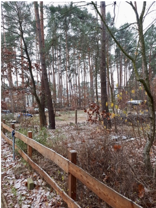
Abb. 10: Zäune begrenzen die Grundstücke