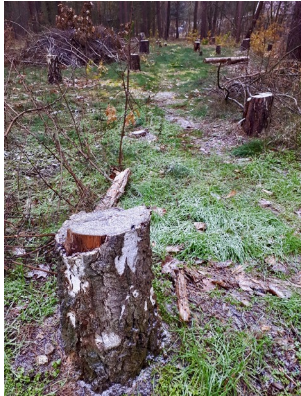
Abb. 9: Forstliche Nutzung hiebsreifer Bäume