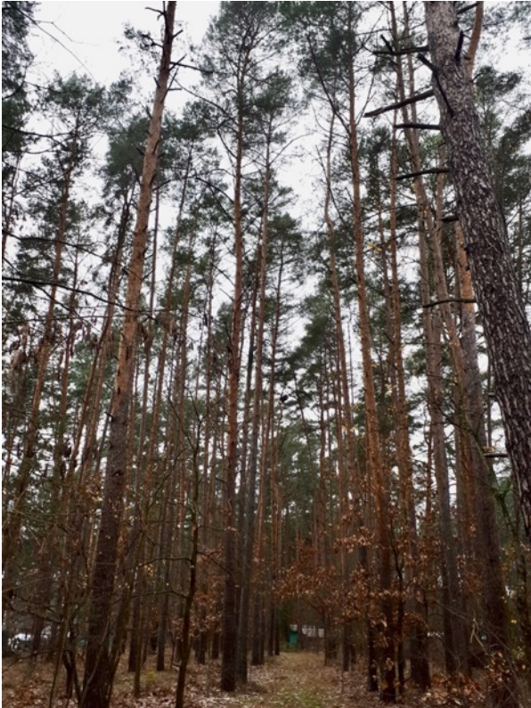
Abb. 4: Kiefernwald des Geltungsbereiches