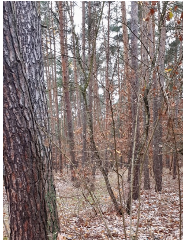
Abb. 7: Heterogene Altersstruktur des Kiefernwaldes