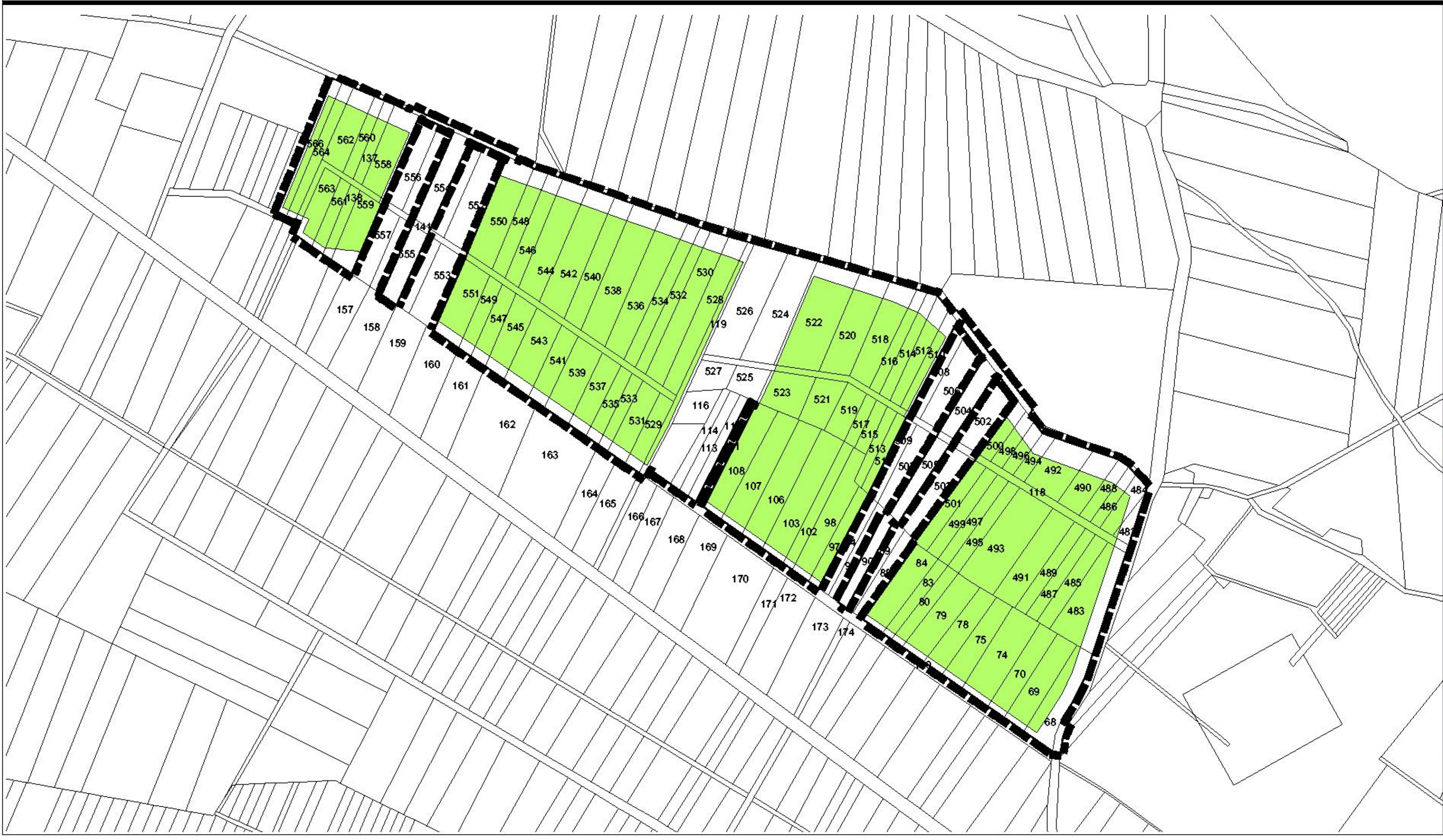
Übersichtskarte 1 : 25.000