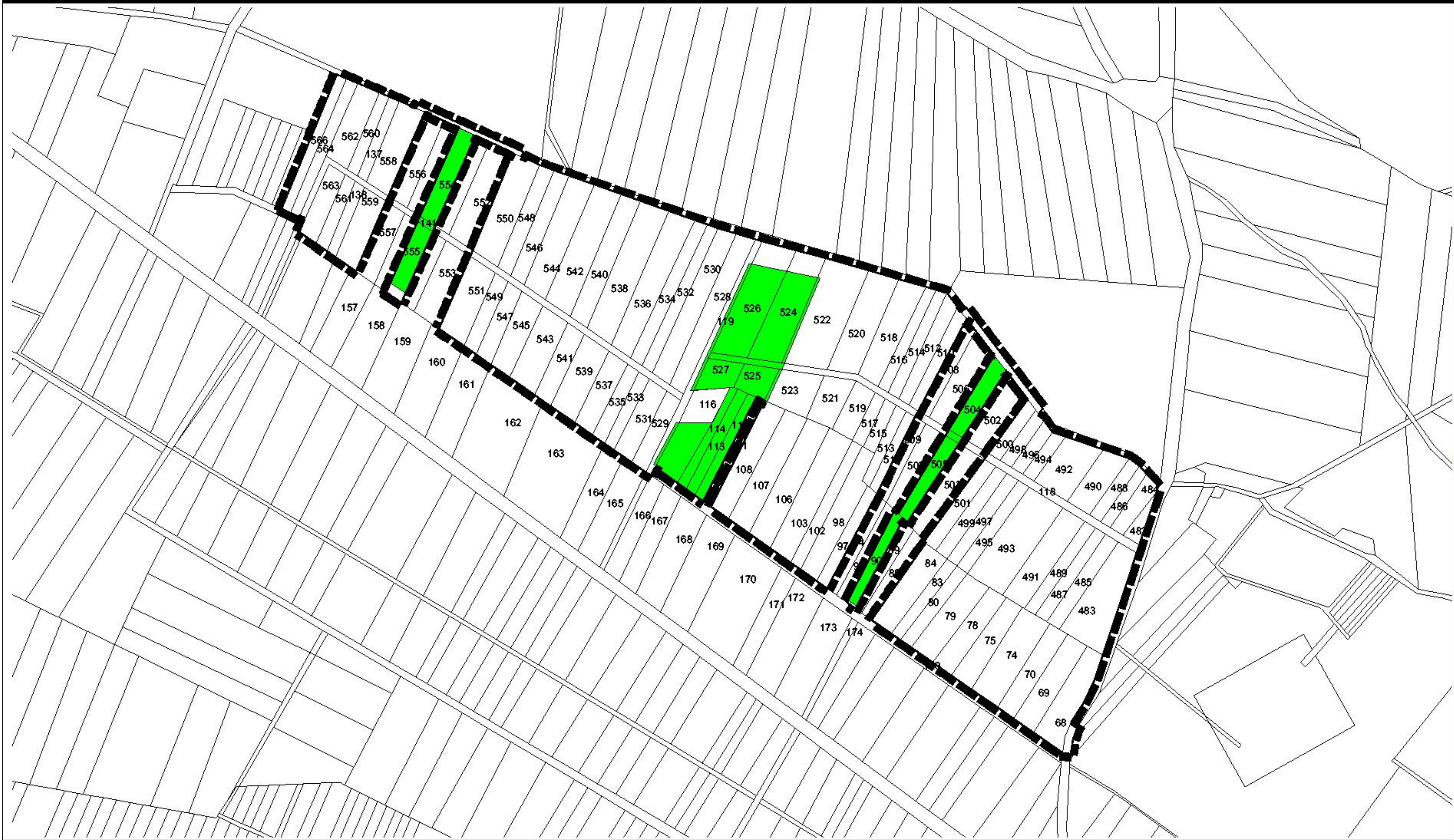
Übersichtskarte 1 : 25.000