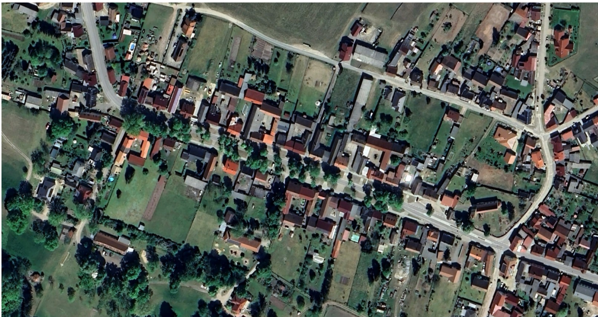
Abb. 3: Ortskern Cammer, Straßenanger mit wertvollem Baumbestand

Die als Einzeldenkmal geschützte Bockwindmühle an der Nordwestspitze der Ortslage Cammer besitzt ebenfalls landschaftsbildprägende Funktion. Eine zweite ehemalige Windmühle, die Holländermühle östlich außerhalb der geschlossenen Ortslage Cammer besteht noch als Gebäude, ist aber ohne Flügel nur noch im Nahbereich erkennbar.