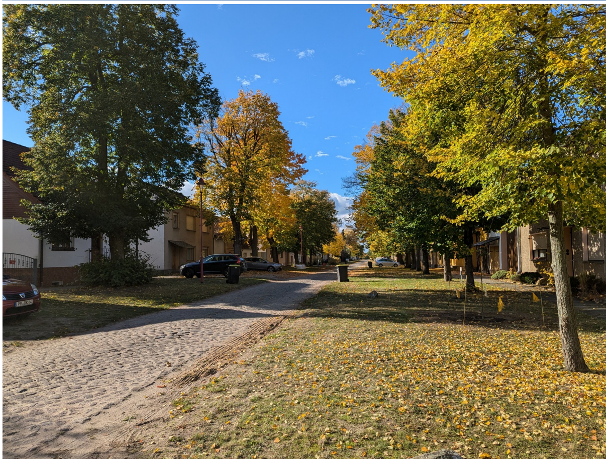
Abb. 5: Ortskern Freienthal, Straßenanger