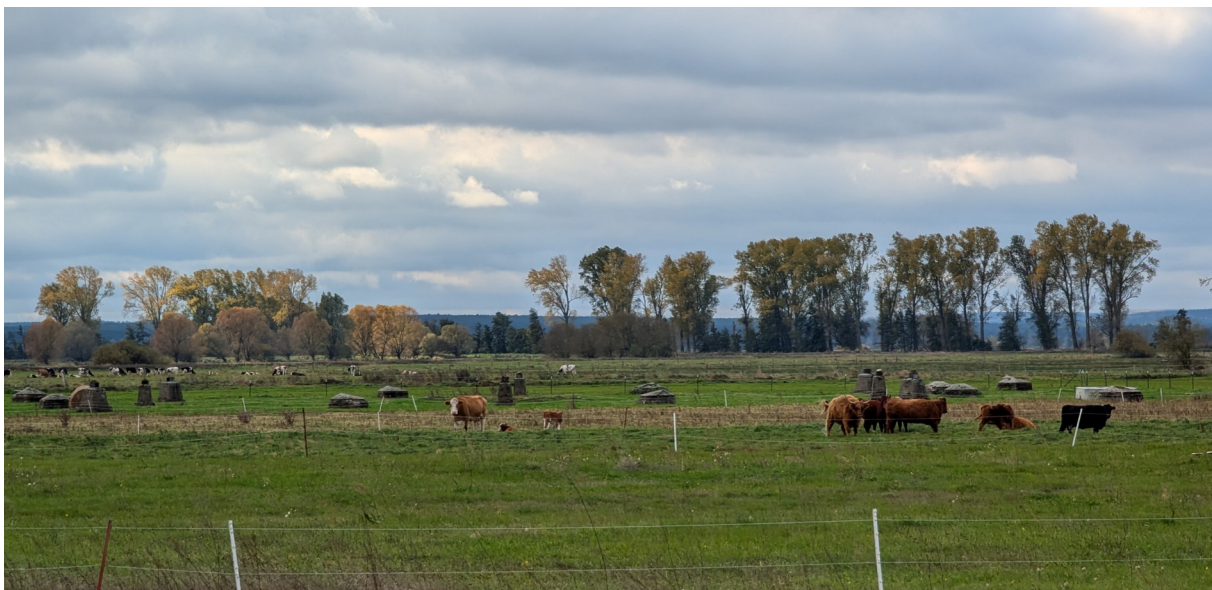
Abb. 1: Belziger Landschaftswiesen

Besonders charakteristisch für die Gemeinde Planebruch ist die Planeniederung mit den Belziger Landschaftswiesen, die teilweise bei Jahrhundert- oder Extrem-Hochwasser überschwemmt werden. Als Großtrappenlebensraum mit großflächigen Äckern und Grünlandbereichen erscheint das Landschaftsbild allerdings nur von mittlerer Qualität, da wenig strukturiert und weitgehend eben; dennoch besteht gerade darin die charakteristische Eigenart der Belziger Landschaftswiesen und ist in diesem Zustand zu erhalten.