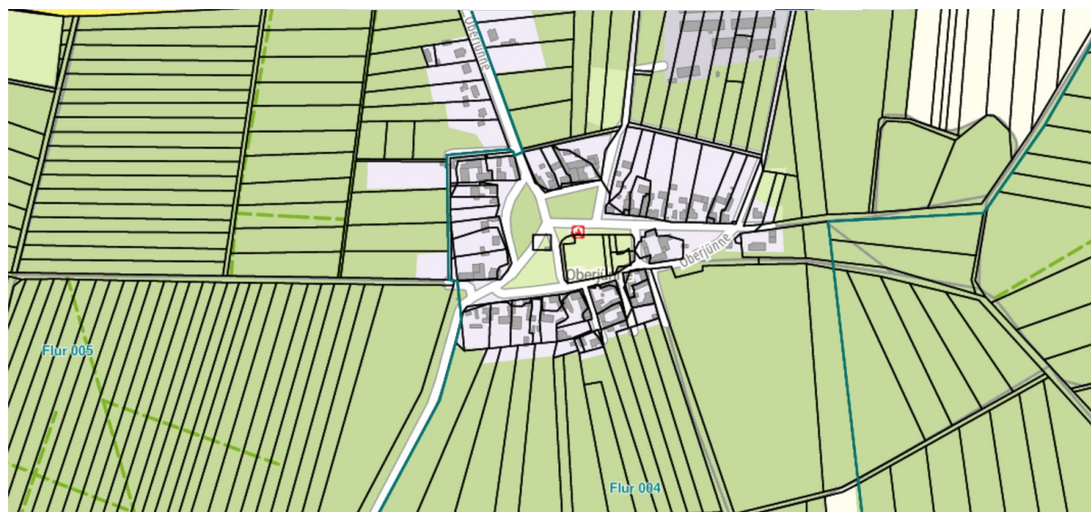
Abb. 6: Ortskern Oberjünne, Platzanger