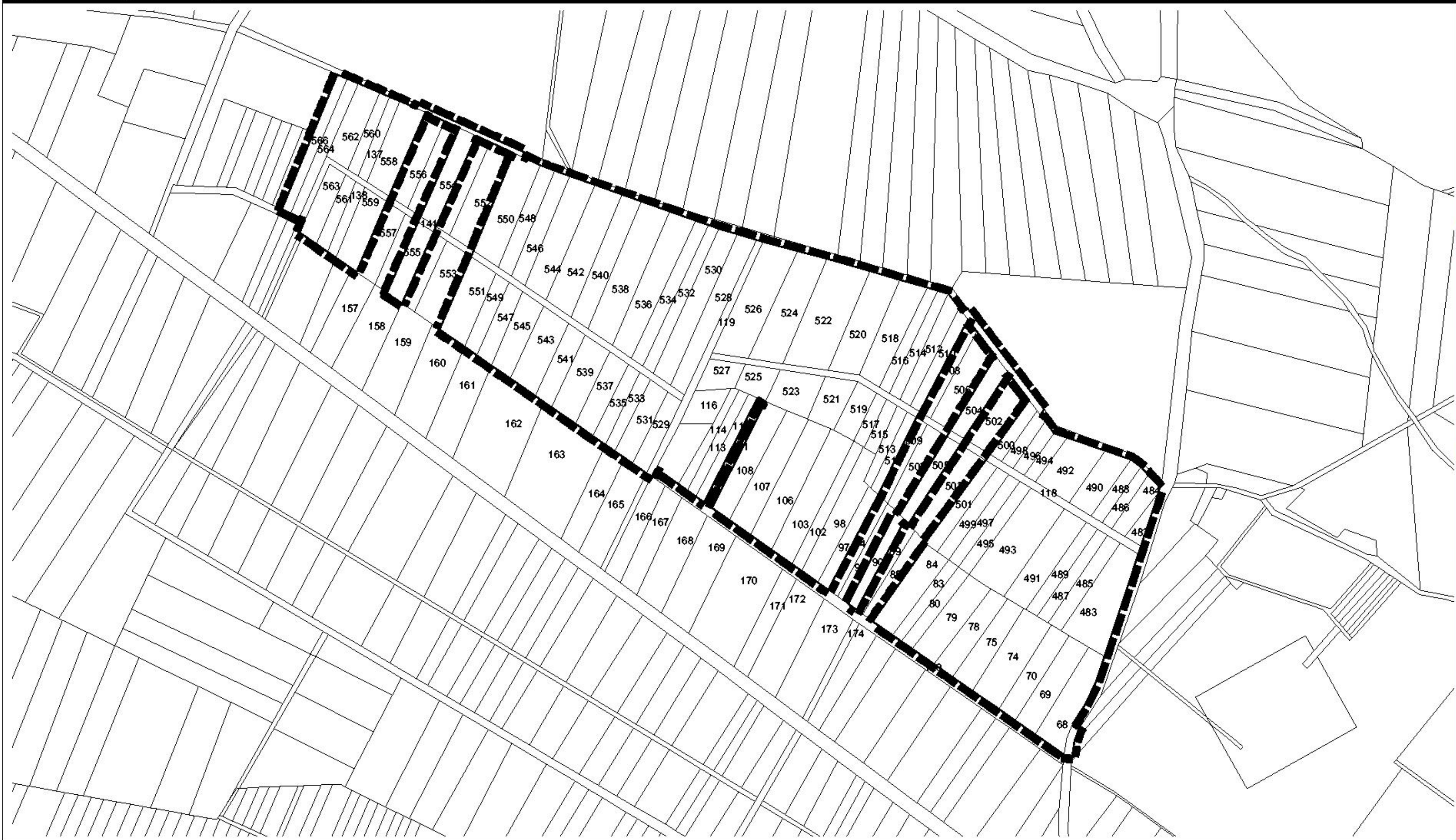
Übersichtskarte 1 : 25.000