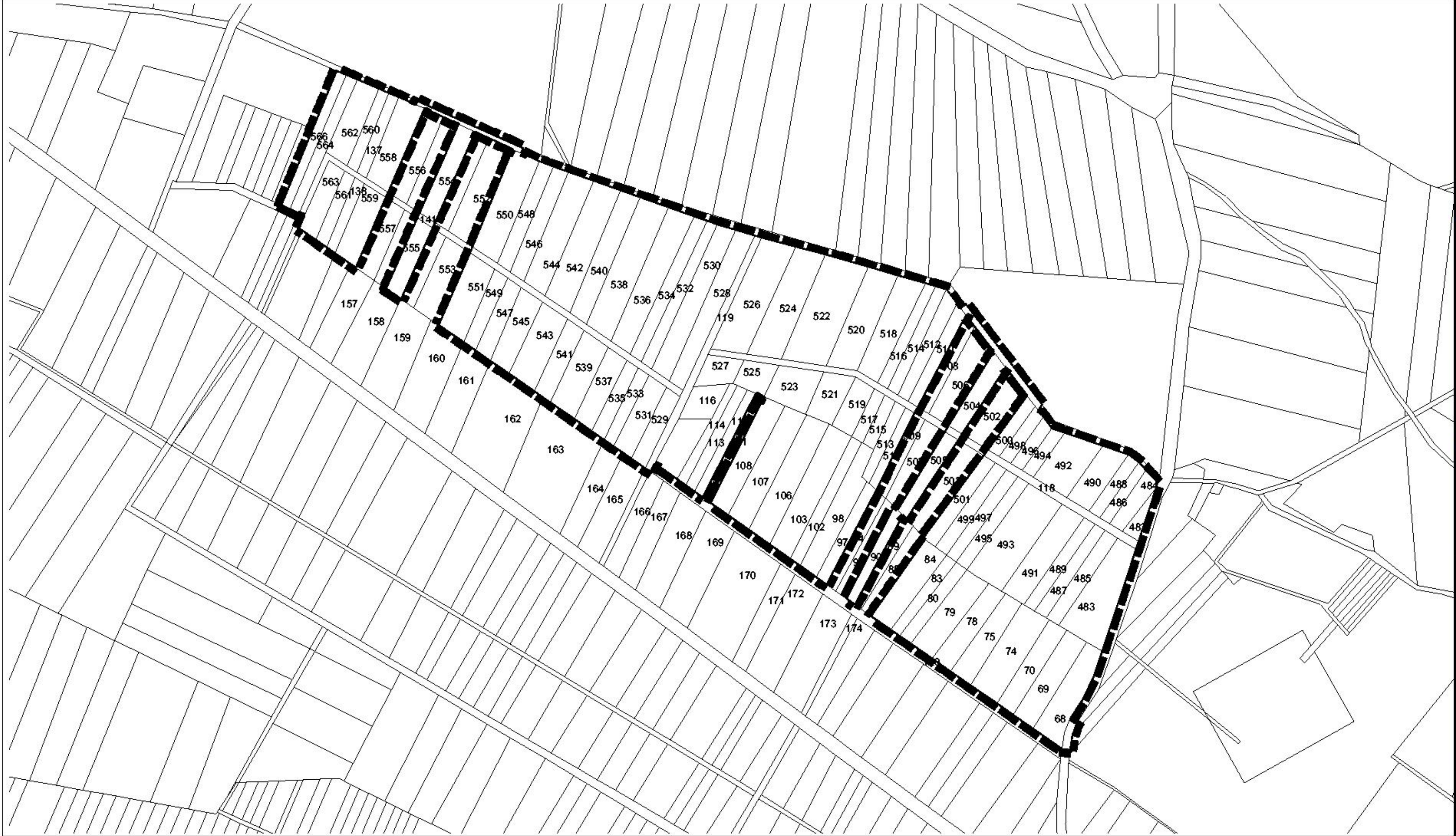
Übersichtskarte 1 : 25.000