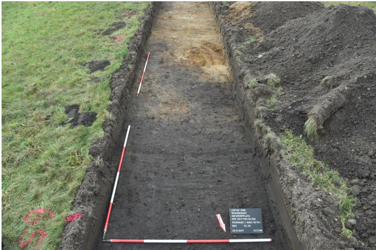
Abbildung 8: Sondage 1, Südlicher Teil der grabenartigen Struktur