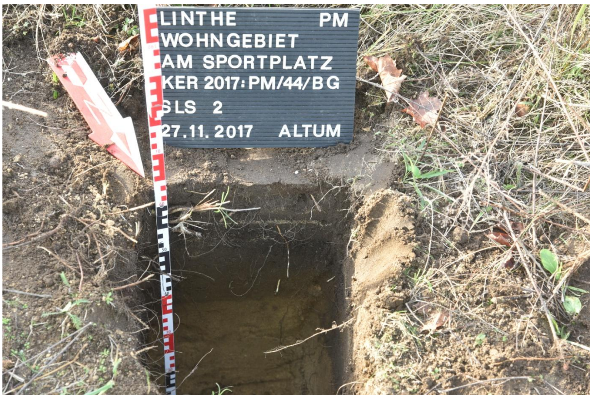
Abbildung 11: Sieblochsondage 2