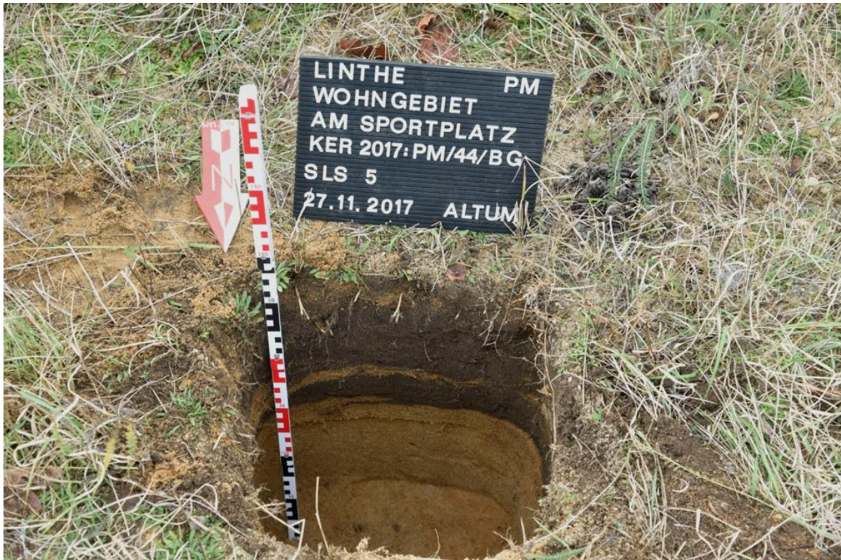
Abbildung 10: Sieblochsondage 5