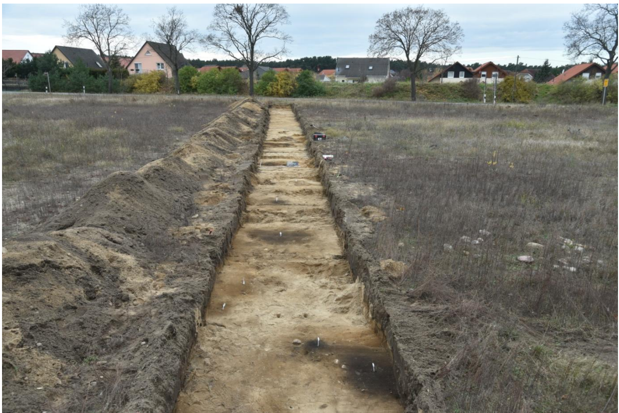
Abbildung 5: Sondageschnitt 2, Überblick, Blickrichtung WSW