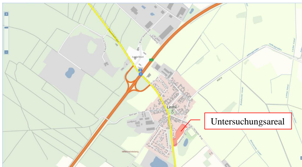
Abbildung 1: Lage des Untersuchungsareals, Kartengrundlage: BB-Viewer

Kai Schirmer M.A. Königswinterstraße 12 10318 Berlin Tel: 030-50014138 Fax: 03050014140