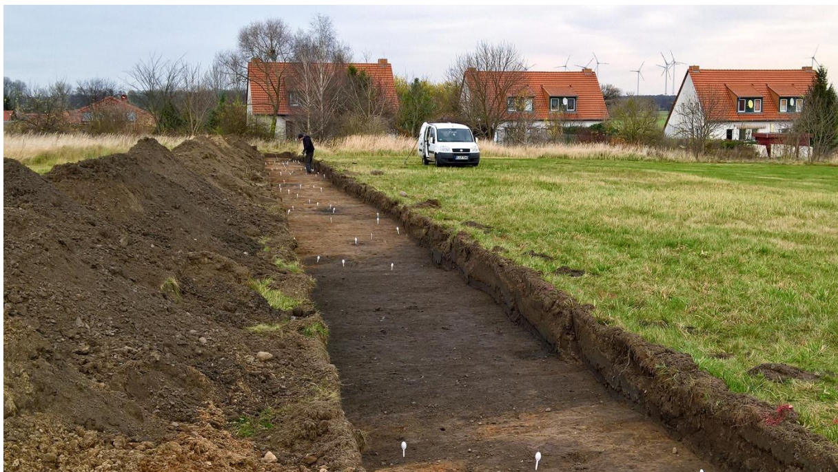
Abbildung 9: Sondage 1, Grabenstruktur in der Übersicht