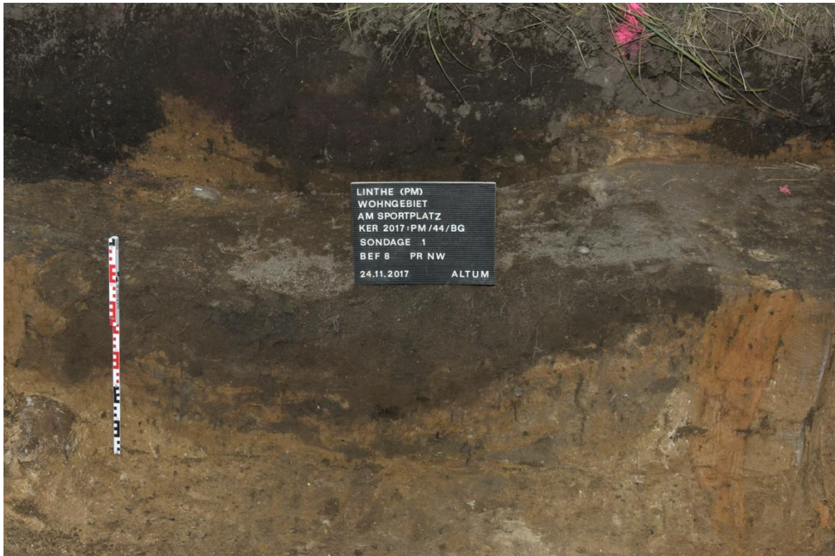
Abbildung 6: Sondage 1, Bef. 8 im Profil (Grube enthielt Harte Grauware)