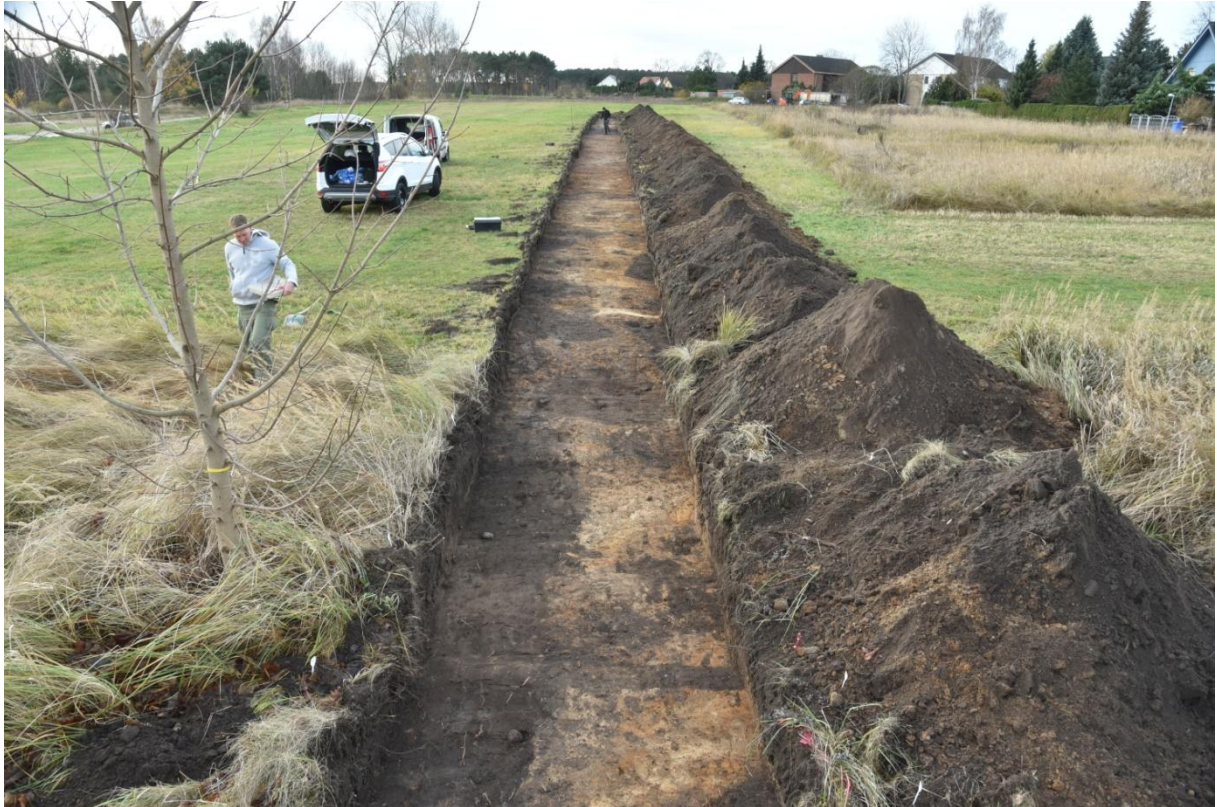
Abbildung 4: Sondageschnitt 1, Überblick, Blickrichtung SW