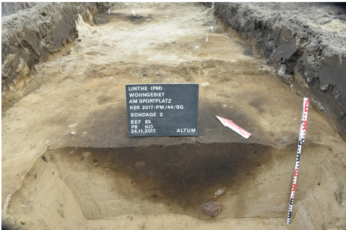
Abbildung 7: Sondage 2, Bef. 85 im Profil