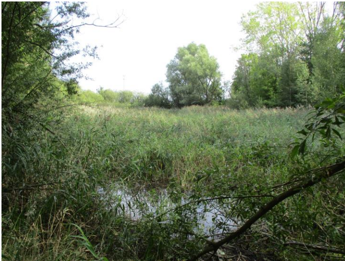
Foto 5: Kleingewässer mit Schilf- und Röhrichtvegetation am südöstlichen Rand, außerhalb des Plangebietes