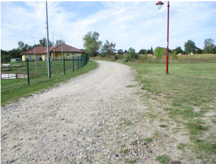
Foto 3: östliche Grenze des Plangebietes - Lerchenweg und Sportplatz