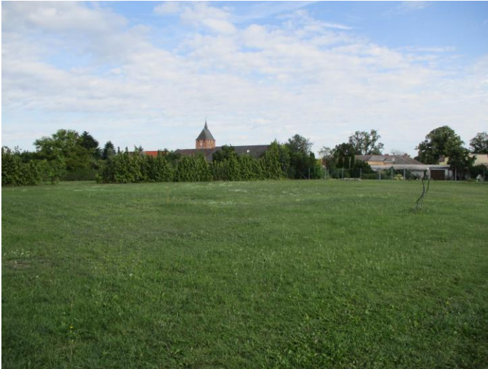
Foto 2: regelmäßig gemähte Frischwiese am nordwestlichen Rand des Plangebietes